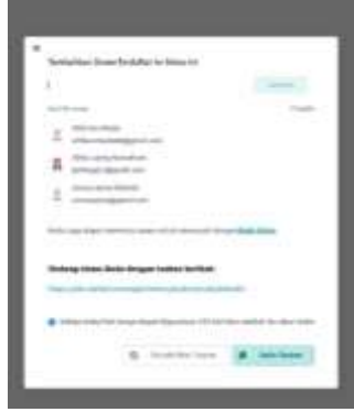
الصورة رقم 8 : الرابط

3 يقوم الطلاب بإنشاء حساب Alef Education