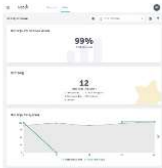
الصورة رقم ١٢ : تقدم الطلاب

من خلال ميزة تقدم الطلاب وتقدم الفصل، للمعلمين مراقبة تقييمات الطلاب على بطاقات التعلم ومعرفة الطلاب الذين أكملوا بطاقات التعلم الخاصة بهم. يسهل على المعلمين من خلال ميزة تقدم الفصل هذه متابعة تطور طلابهم في التعلم.