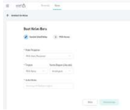
الصورة رقم 6 : إنشاء فصل

ستظهر معلومات تفيد بأن التسجيل قد اكتمل ويمكن الولوج إلى منصة Alef. بعد ذلك، للمعلم إنشاء فصل افتراضي وإضافة الطلاب عبر النقر على " Buat Kelas Baru ". أدخل عنوان الفصل مثل " Bahasa Arab"، وما إلى ذلك. سيتم ملء مواد التعليم تلقائياً. ثم انقر على " Buat Kelas ".