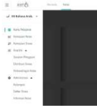
الصورة رقم 7: الميزة Alef Education

المرحلة السادسة: الطلاب إلى الفصل المنشأ، انقر على "daftar siswa"، ثم انقر على "Tambah Siswa"، ثم "Salin Tautan" وشارك رابط الفصل مع الطلاب عبر مجموعة WhatsApp. المرحلة الأخيرة: يقوم الطلاب بإنشاء حساب Alef Education.