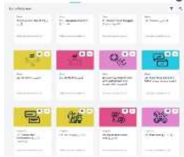
الصورة رقم 9: بطاقة التعلم

1 المواد التعليمية وأسئلة التمرين (خاصية بطاقة التعلم)