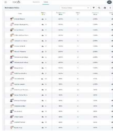
الصورة رقم ١٣ : تقدم الفصل