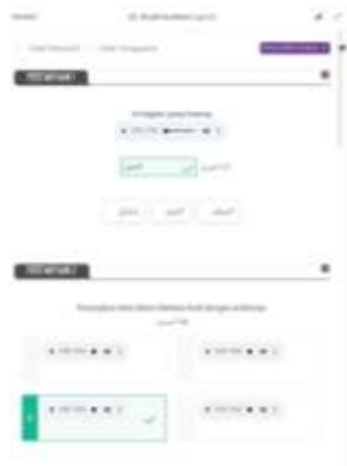
الصورة رقم ١١ : سؤال التمرين

تعتبر بطاقة التعلم خاصة تحتوي على أكثر من ١٥٠ درسًا ممتعًا وتفاعليًا ومُنظمًا وفقًا لمعايير منهج إندونيسيا. تحتوي بطاقة التعلم على مفردات مصورة ومزودة بالترجمة إلى اللغة الإندونيسية وصوت يذكر كيفية نطق تلك المفردات. تقدم Alef Education بشكل جذاب باستخدام صور وأصوات تفاعلية.