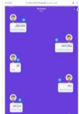
الصورة رقم ١٠: عرض بطاقة التعلم